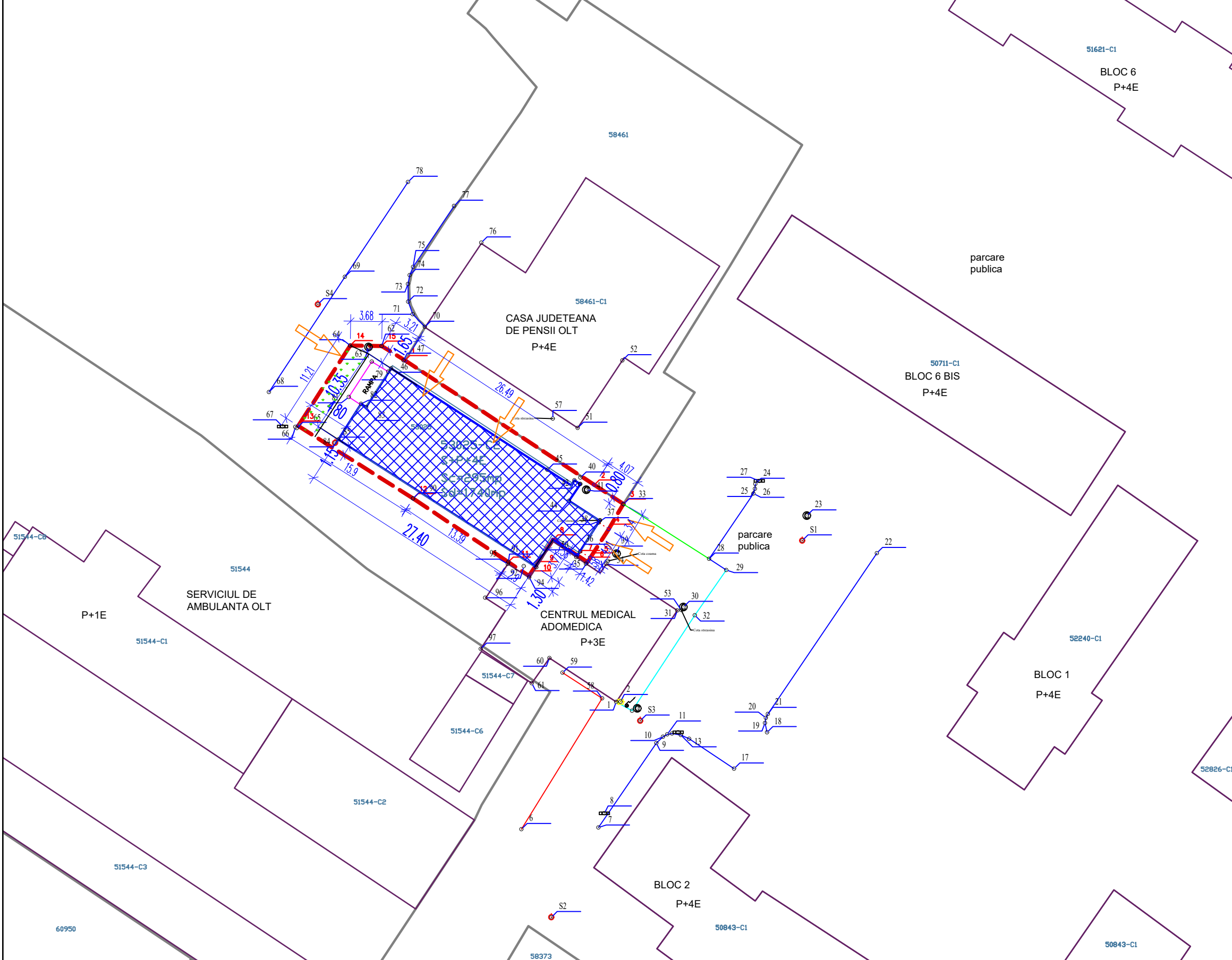
TABEL COODONATE STEREO 70 NR.CAD.53025 SLATINA

BILANT TERITORIAL SITUATIE EXISTENTA: S teren intravilan nr.cad.53025 = 456 mp S construita constructie existenta (C2) = 295 mp S desfasurata constructie existenta (C2) = 1740 mp Regim inaltime constructie existenta (C2) = S+P+4E POT existent = 64.70% CUT existent = 3.82 Accesurile pe teren se realizeaza din calea de acces de pe latura nord-vestica, respectiv de pe latura sud-estica; accesurile la imobilul C2 existent se realizeaza prin parter, pe latura nord-vestica, nord-estica, respectiv de pe latura sud-estica Funcțiune constructie existenta (C2) = policlinica umana (Lisimed) Locurile de parcare sunt asigurate la parcajele auto publice din zona, in interval orar 7-19